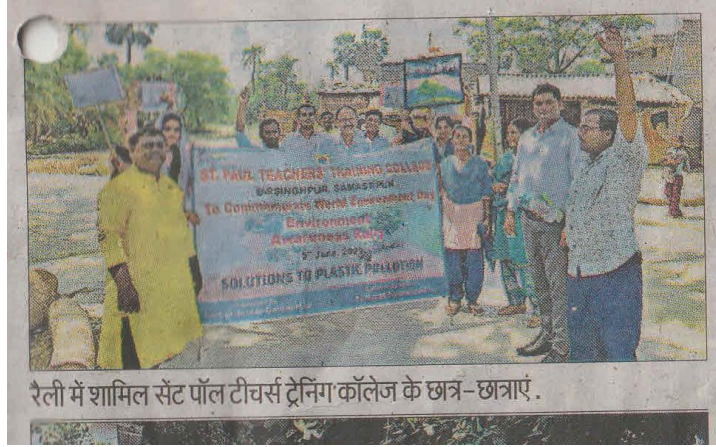
रैली में शामिल सेंट पॉल टीचर्स ट्रेनिंग कॉलेज के छात्र-छात्राएं.

Publish on 6 th June 2023 Parabhat Khabar World Environment Day